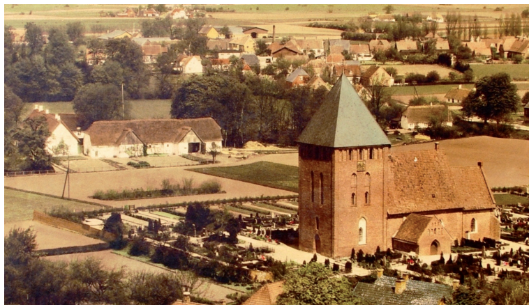
Østofte kirke og præstegård. Udsnit af luftfoto (Sylvest Jensen) i privat eje.