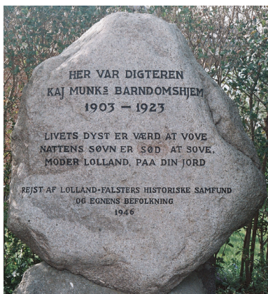
Mindestenen i Opager. Værselinjer "Livets Dyst er værd at vove / Nattens Søvn er sød at sove / Moder Lolland, paa din jord" fra Sangen til vor Ø .

Ricardt Riis: Et spark til himlens dør , (SHD), Syddansk Universitetsforlag 2013.