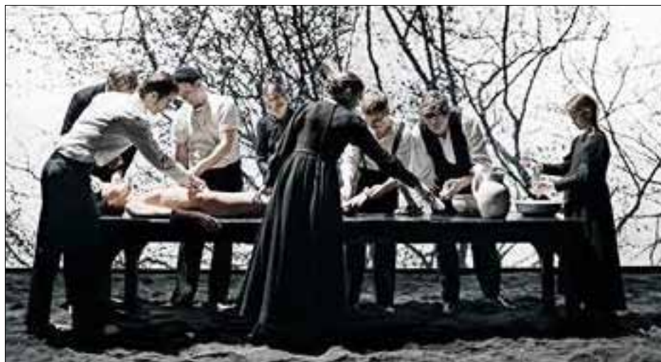
Ordet. Aarhus teater 2020