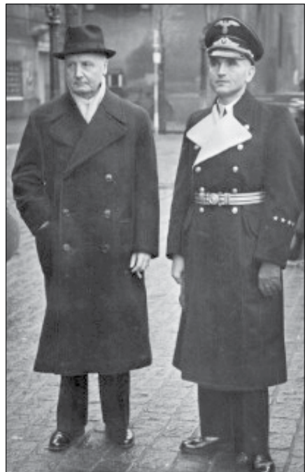
Erik Scavenius og Werner Best

Men de accepterede da den fredsbesættelse af Danmark, hvor hverken kongen eller de folkevalgte blev sat fra magten, eller vi fik en naziregering. - Tænk at disse to hårde kritikere - af kongen og kronprinsen og deres statsministre - i 2003 begge stemte for at deltage i den ulovlige angrebskrig mod Irak. Derved bragte de sig i en lighedsrelation til Nürnberg-processen, der anklagede Nazityskland for ulovlige angrebskrige.